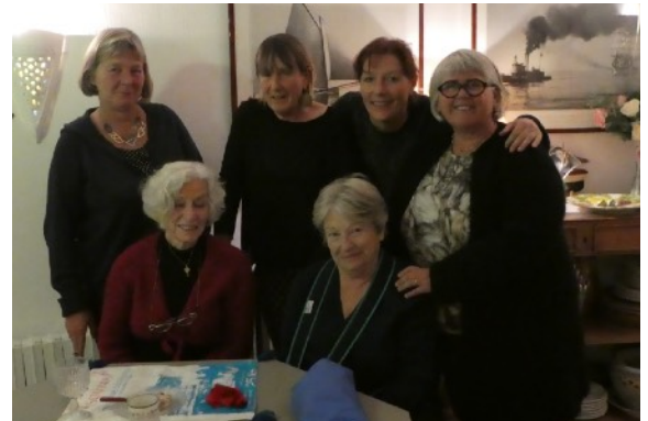
Réunion du CA de l'Association le 7 novembre : bilan des dernières actions et projets à venir...